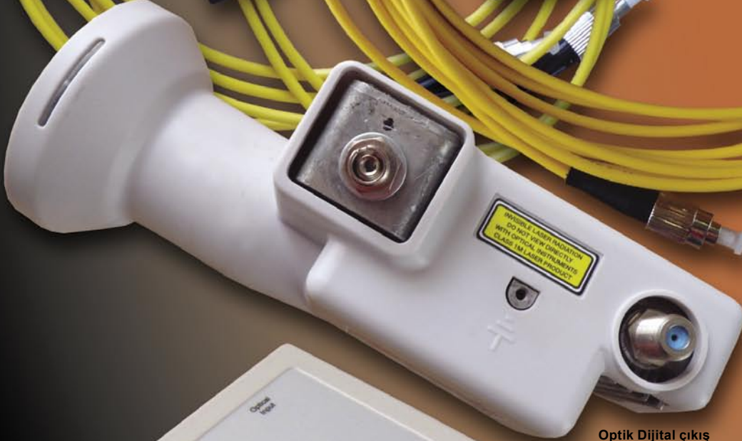
Optik Dijital çıkış ve Güç kaynağı için F konektör