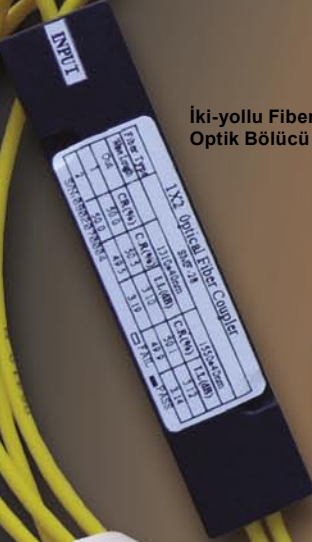
İki-yollu Fiber-Optik Bölücü