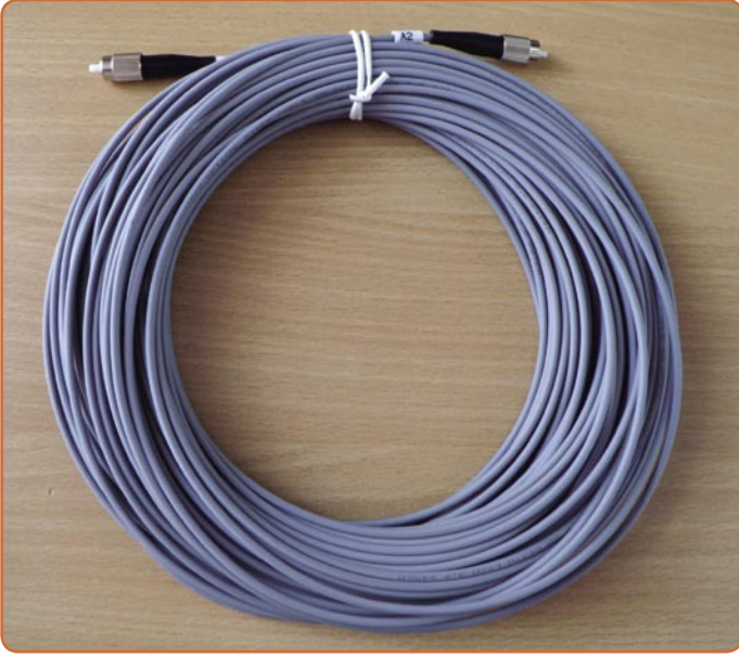
Bağlantılı 30m Fiber-Optik kablo

siniz. Global Invacom hatta DVB-T sinyallerini koaksiyel kablo ile izleyenleri bile göz önünde bulundurmuş: özel bir adaptörle fiber optik kabloyu burada kullanabiliyorsunuz.