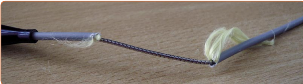
Fiber-Optik Kabloyu korumak için Koruyucu Metal Ceket

Uydu yayınlarını izlemede yeni bir çağın şafağında ve birkaç yıl sonra müzelerde gördüğümüz koaksiyel kablolarla şaşkın bakışlar atmanın dışında uydu antenleri ve uydu alıcılarını da unutmuş olacağız. Global Invacom gibi firmalar sayesinde!