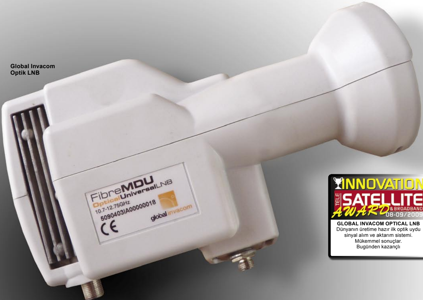
Global Invacom Optik LNB