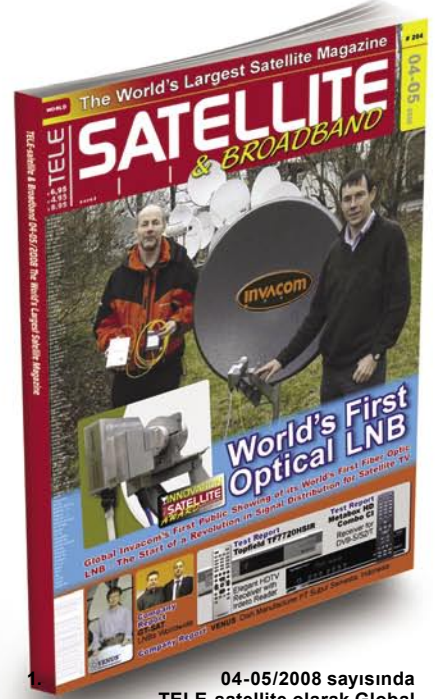
04-05/2008 sayısında TELE-satellite olarak Global Invacom'un optik LNB'sinin ilk resmi tanıtımını yapmıştık

Optik LNB'ye bu kadar önem kazandıran özellikleri üzerinde duralım.