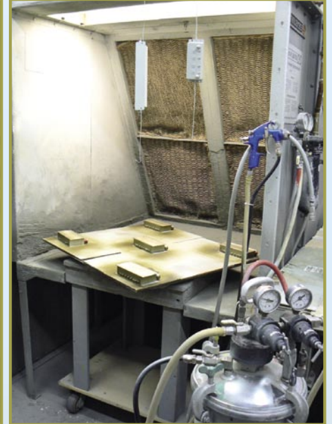
■ MFC neredeyse her şeyi kendisi yapıyor: tamamlanmış filtreler burada koruyucu bir boya ile kaplanıyor.