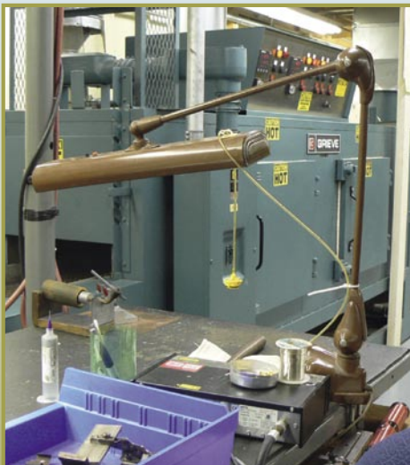
■ ...Gerçek lehimleme işlemi, filtrelerin içinden geçirildiği bu lehimleme firında yapıyor.