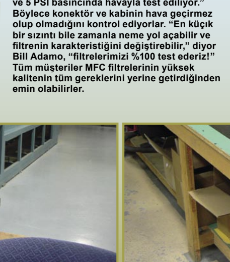
■ Müşterilere doğru ilerleme yanında: tamamlanmış ve tamamen test edilmiş filtreler paketlenip dünyanın her tarafındaki müşterilere gönderiliyor.