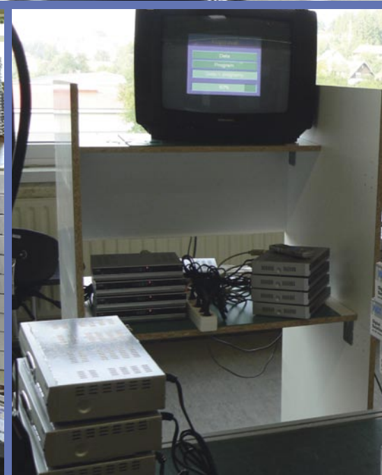
■ Vy över produktionslokalen: här hämtas komponenterna när kabinetten utrustas med tuners, berättar Peter Löble: "På detta sätt kan vi täcka flera marknader med en basenhet, beroende på kraven på de olika marknaderna med den extra fördelen av att kunna garantera kvalitetssäkring. Tre produktgrupper tillverkas här: fullt utrustade HD-mottagare med CA, CI USB och VFD-skärm, grundläggande modeller med begränsade funktioner samt – från nyligen – LINUX-basade mottagare.