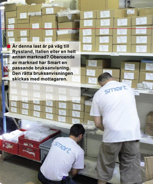
■ Är denna last är på väg till Ryssland, Italien eller en helt annan marknad? Oberoende av marknad har Smart en passande bruksanvisning. Den rätta bruksanvisningen skickas med mottagaren.