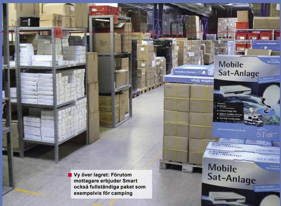
■ Vy över lagret: Förutom mottagare erbjuder Smart också fullständiga paket som exempelvis för camping