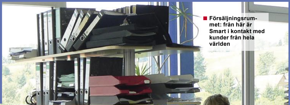
■ Försäljningsrummet: från här är Smart i kontakt med kunder från hela världen