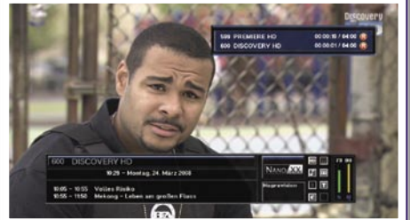
Paralelno snimanje dva kanala (čak i HD) |