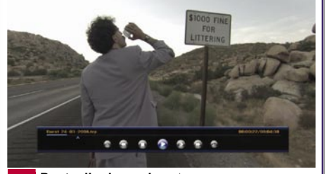
Postavljanje markera |