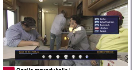
Opcije reprodukcije |