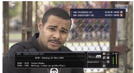
Δύο Ταυτόχρονες Εγγραφές (ακόμα και HD)!