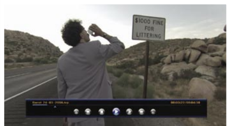
Ρύθμιση ενός Σελιδοδείκτη!