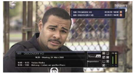
Dvě nahrávky (dokonce HD) zároveň!